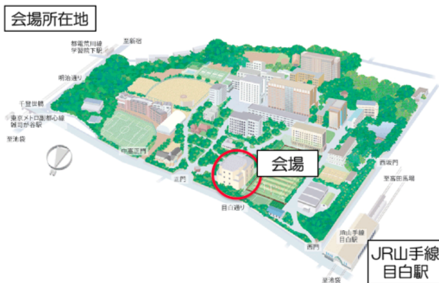
学習院創立百周年記念会館1階